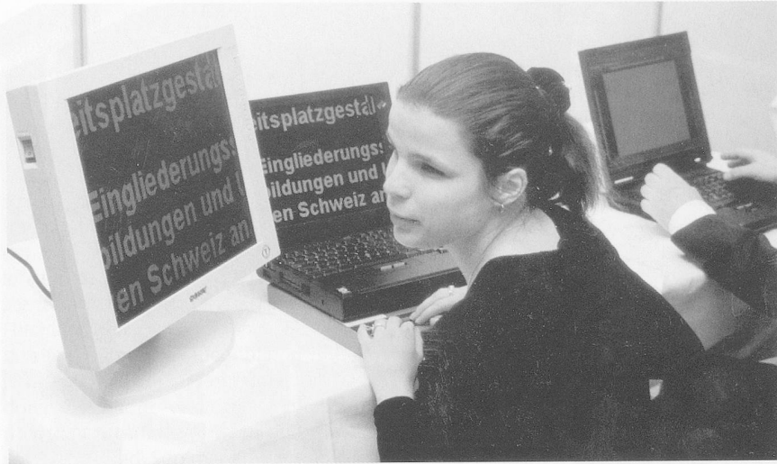
Eine sehbehinderte Frau am Computer, der vorne, zusätzlich zur normalen Tastatur, mit den Zeichen der Blindenschrift versehen ist. Die gewöhnliche Maschinenschrift kann bis 60fach vergrössert werden.

hinderte mehr, als Nichtbehinderte. Weber: «Jeder Mensch soll einen Arbeitsplatz erhalten, der seinen Möglichkeiten entspricht.»