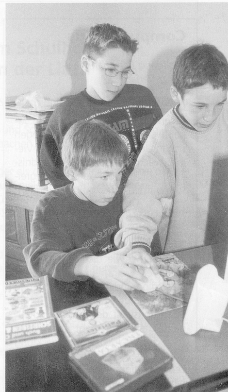
Am Compi: Ob einzeln oder gemeinsam, der Blickwinkel erfasst das eine gemeinsame Zentrum.

Die Welt am Monitor nimmt gefangen, sie erschreckt und tröstet, und sie bindet ein. Eine Phantasiewelt, aber ganz anders als damals, als verkleidet wurde, versteckt, als wir die Regisseure der Spiele waren. Jetzt bestimmt die Maschine das Spiel. Ein Zögern in der Reaktion, ein kurzes Überlegen – und schon ist es zu spät, der Absturz ist einprogrammiert. Nur wer sich voller Konzentration auf das «Spiel» einlässt, der kommt weiter, überlebt, erreicht ein Ziel, welches sofort als Steigerung im Schwierigkeitsgrad neu beginnt. Welche Seele baut da ab oder auf? Wer verar-