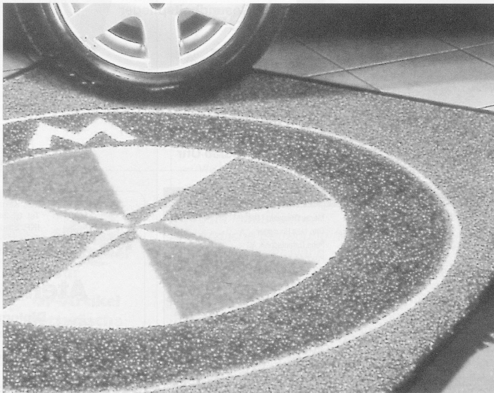
Die Coral-Logo-Matte verbindet hohe Funktionalität mit nahezu unbeschränkten Möglichkeiten, das eigene Logo zu präsentieren.

Überall, wo starker Laufverkehr herrscht und grober Schmutz und Feuchtigkeit abgehalten werden müssen, ist Coral Brush genau richtig und hält die nachfolgenden Bodenbeläge wirkungsvoll sauber. Coral Brush überzeugt durch kreative Farbkombinationen. Der Belag ist in drei