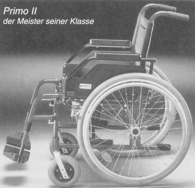
Primo II der Meister seiner Klasse

Mühlebachstr. 45 8801 Thalwil Tel. 01 720 44 82 / 079 629 75 52 e-mail: sekretariat@heyoka.ch