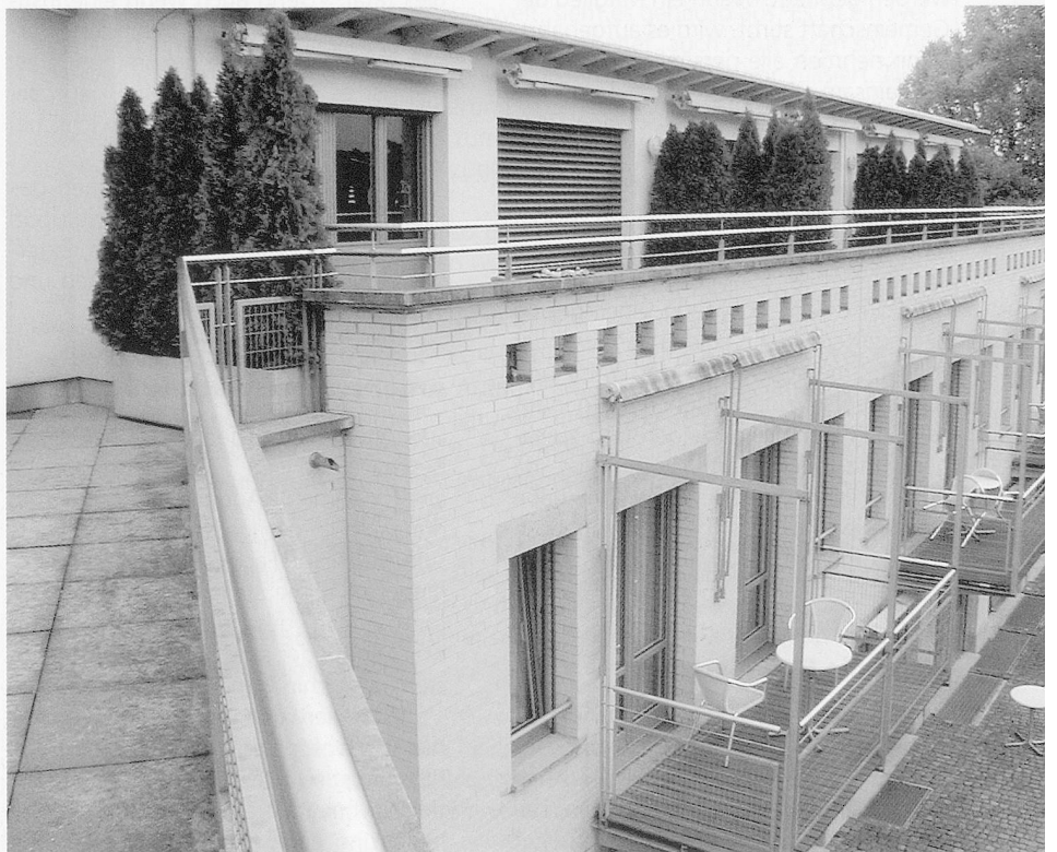
Die Rentnerinnen und Rentner der Zwyszigstrasse verbringen ihren Lebensabend in einem modernen Haus mit drei Betagtenwohnungen und 10 Alterswohnungen.

Wie viele Behinderte erreichen in der Schweiz überhaupt das Rentenalter? Zahlen fehlen. «Niemand hat Interesse, beim Thema Menschen mit einer Behinderung empirische Studien durchzuführen. Denn mit diesen Zahlen erschliesst man keinen neuen Markt, son-