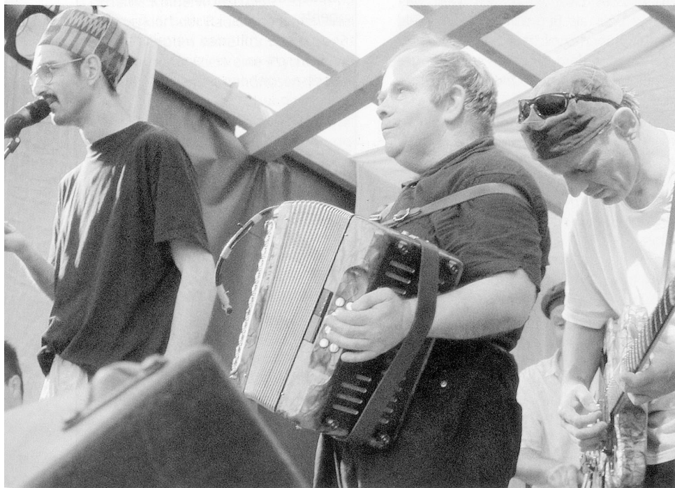
Die Musikgruppe «Die Regierung» (Verein Chupferhammer): Wie aus musikalischen Behinderten ganz «normale» Profi-Musiker werden, ist auch eine Konsequenz des Normalisierungsprinzips.

Die kulturellen und sozialen Muster, wie sie in den verschiedenen Gesellschaften angelegt sind, sollten sich in der Lebenswelt der Menschen mit geistiger Behinderung widerspiegeln. Statt dem immergleichen Dämmerzustand der Anstalten sollte sich auch für die Behinderten der Alltag in Werktagen und Wochenenden strukturieren, Ferien und Feste als besondere Herausgehobenheit auf der Agenda stehen. Nirje leitete aus dem normalen Leben auch die Forderung nach Arbeit wie nach einer individuell gestalteten Privatsphäre ab.