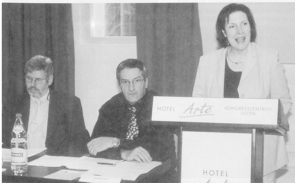
Nationalrätin Christine Egerszegi-Obrist wünscht gutes Gelingen.

als Präsidentin viel gelernt. Gerade die Situation Arbeitgeber–Arbeitnehmer unter einem Dach habe sie 1994 angesprochen und herausgefordert, das Präsidium im HVS zu übernehmen. Egerszegi: