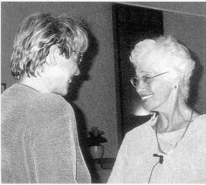
Naomi Feil in einer Trainingssituation

Entwickelt wurde die Validation-Methode von der in München geborenen Amerikanerin Naomi Feil. Entscheidend ist, dass mit dieser Methode, oder eher mit dieser Grundhaltung, nicht versucht wird, den desorientierten Menschen auf die Stufe des Gesunden zu bringen. Validation heisst, auf ihn einzugehen, zu versuchen, ihn zu verstehen, «in seinen Schuhen zu gehen». Dieses Verhalten, so Feil, schafft Vertrauen.