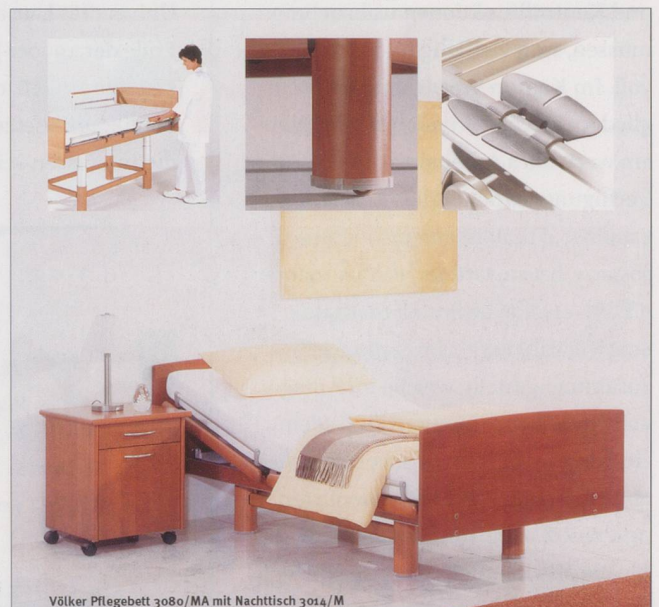
Völker Pflegebett 3080/MA mit Nachttisch 3014/M

Lining Tech Die Nr. 1 für Rohr-Innensanierung