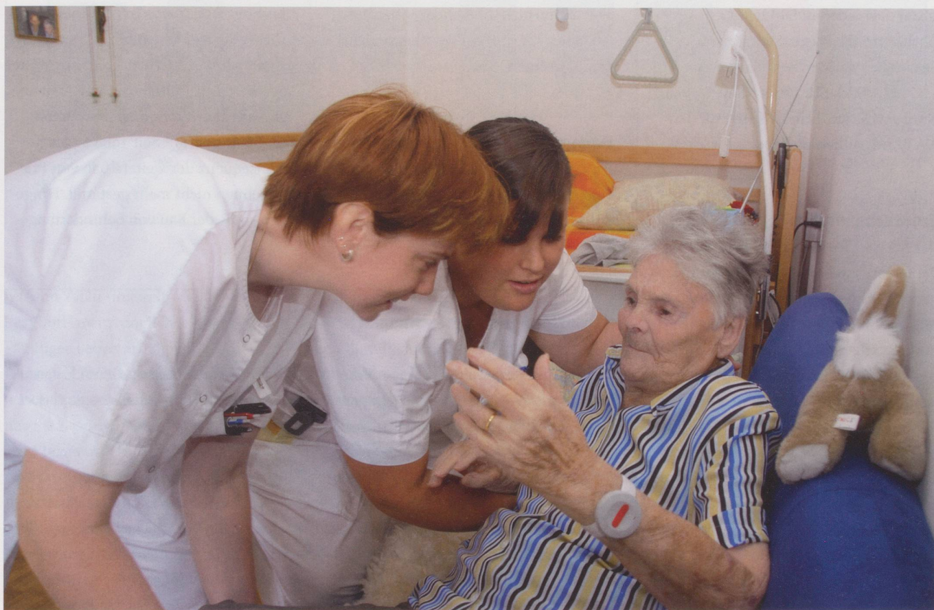
Mit der gemischten Finanzierung der Langzeitpflege ist die Schweiz ein Sonderfall.

Für die Finanzierung der Langzeitpflege in Holland massgeblich ist der 1967 geschaffene Akt für „besondere Krankheitskosten“ (AWBZ). Beitragszahlungen an den AWBZ sind für alle Niederländerinnen und Niederländer obligatorisch. Die Beiträge sind einkommensabhängig. Damit ist Holland das einzige Land in Europa, in dem bereits seit Jahrzehnten eine institutio-