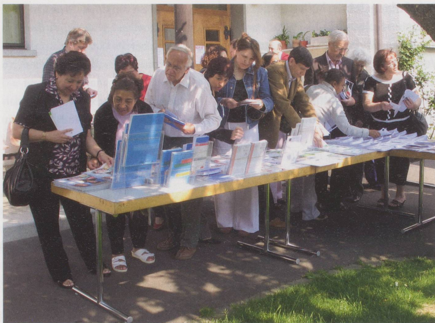
Grosses Interesse an Informationen und Austausch in Ostermundigen.

Ebenfalls hat sich gezeigt, dass die Angehörigen von Migranten in Heimen oder Wohngruppen stärker mit einbezogen werden müssen, um