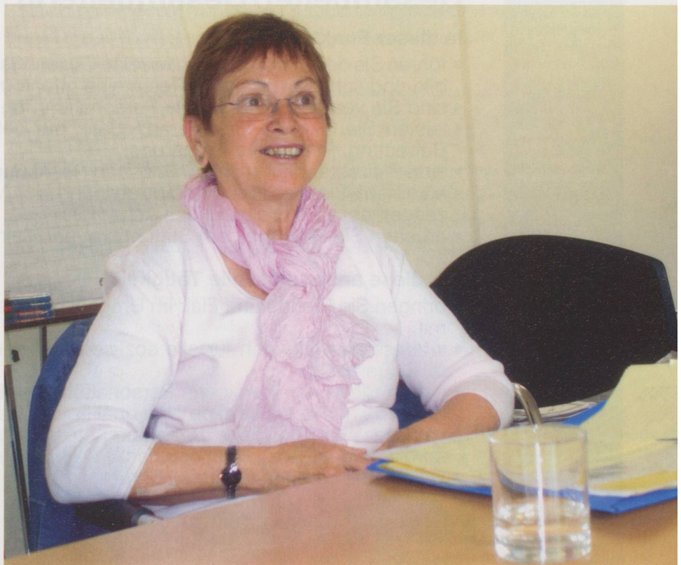
«Es ist wichtig, Abschied zu nehmen».

Kaegi intensiv mit dem Sterben und dem Tod auseinandergesetzt. Dieser habe für sie nichts «Gfürchiges»: «Er gehört, wie schon gesagt, zum Leben.» So breche sie auch nie zu einem Krankenbesuch auf in der Hoffnung, nicht mit einem Todesfall konfrontiert zu werden. Von den Toten verabschieden sich die freiwilligen Sterbebegleiterinnen und -begleiter im Rahmen der Zusammenkünfte mit