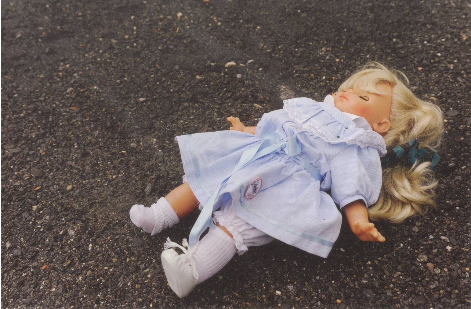
Letztes Jahr untersuchte die Polizei in der Schweiz über 1500 sexuelle Übergriffe auf Kinder.