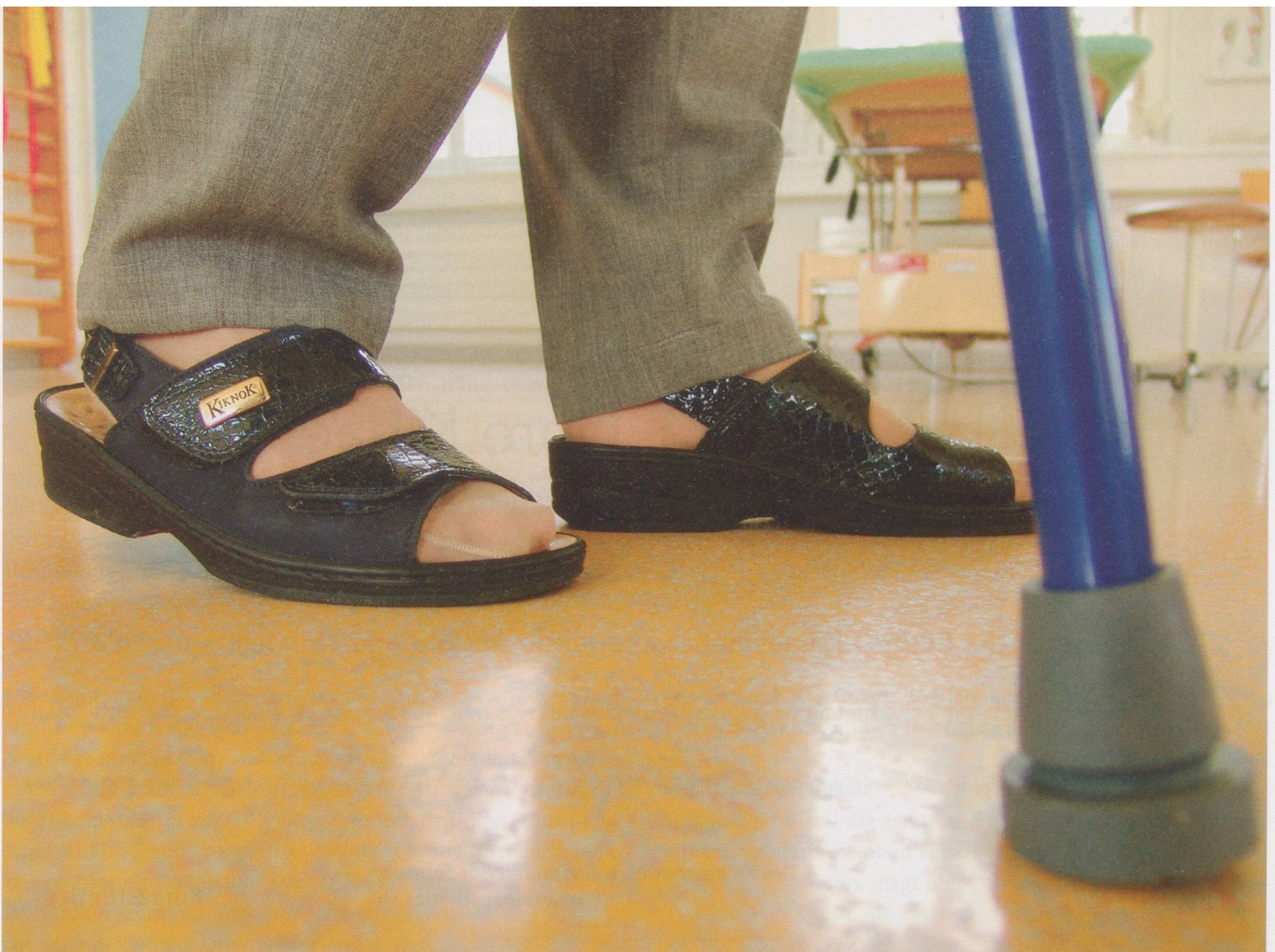
Dem Gefühl, «festgenagelt» zu sein, entgegenzutreten: Schon wenige Schritte bewirken viel.