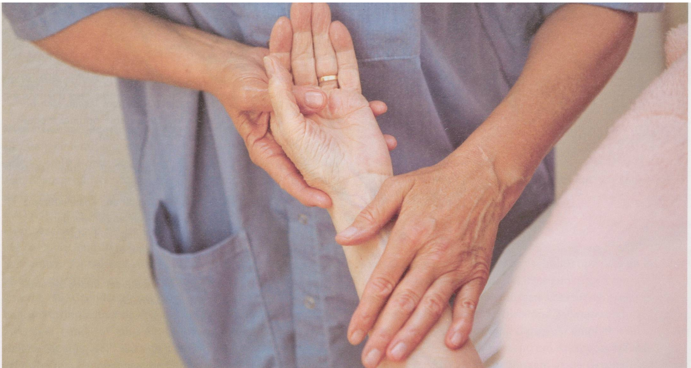
Rhythmische Einreibungen spielen im Alltag im Rüttihubelbad eine wichtige Rolle. Die Methode stammt aus der antroposophischen Medizin.