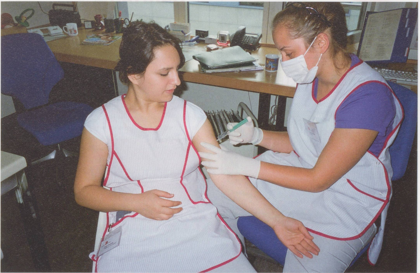
Nicht nur Lehrbetriebsverbände, sondern auch Verbände von Lernenden kommen der Ausbildung zugute: Eine angehende Fachangestellte Gesundheit übt an einer Kollegin das Verabreichen einer Spritze.