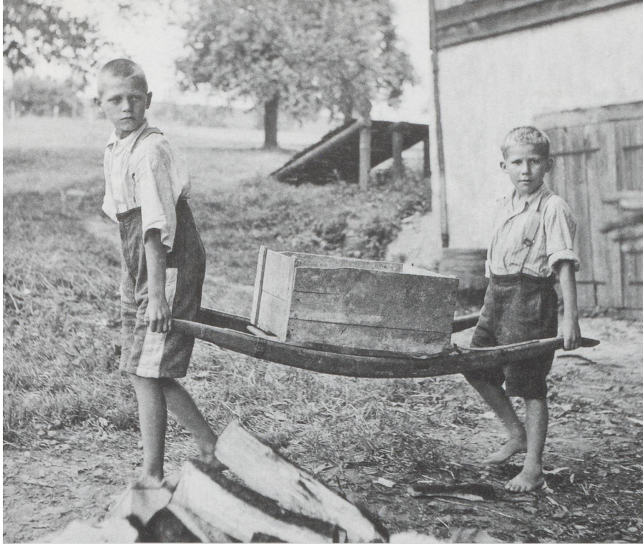
Knaben in der Erziehungsanstalt Sonnenberg bei der Arbeit. Kriens, 1944.