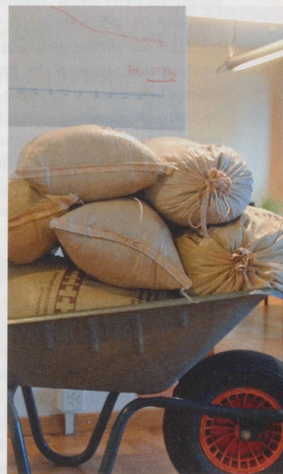
Die PWS-Betroffenen haben abgespeckt: 130 Kilogramm.

Die PWS-Wohngruppe in der Martin Stiftung Erlenbach ist nicht die erste speziell auf diese Behinderung ausgerichtete Wohnform in der Schweiz: Bereits 2004