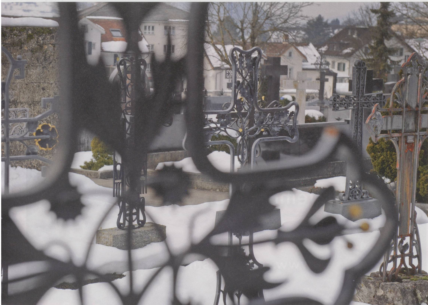
Den Tod wieder in die Gemeinschaft rücken und an die Traditionen der Sterbekultur anknüpfen – dazu rät Ethnologe Bernard Crettaz.

Für mich ist die Belastung des Pflegepersonals – sei es in Pflegeheimen oder in Palliativ-Pflegezentren – ein tatsächlicher Skandal, weil sie nicht genügend Beachtung findet. Kommt dazu, dass der Umgang mit dem Tod manchmal Probleme der Institution offenlegt: alle nicht ausgesprochenen Dinge, Machtkämpfe. Auch die Pflegenden brauchen Zeit, um sich von Verstorbenen zu verabschieden. Und sie benötigen Gelegenheiten, über den Tod und den Umgang mit dem Tod zu reden, ihre Erfahrungen und ihre Sicht der Dinge mitzuteilen. Sie sollen über die Verstorbenen sprechen können, sei es aus ihrem beruflichen oder ihrem privaten Umfeld. Es ist nicht einfach, doch es ist unerlässlich. Es handelt sich dabei um einen langen Lernprozess. Kostendruck, Personalmangel und die Vorgaben der Bettenauslastung sind diesem Prozess allerdings nicht gerade förderlich.