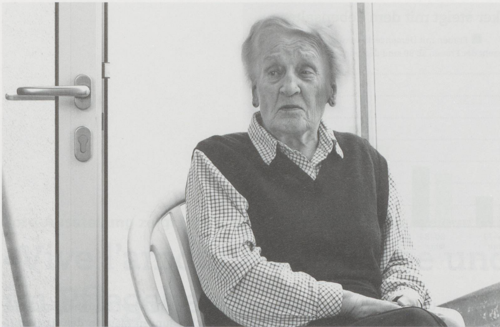
Wer bin ich? Wo wohne ich? Menschen im Spätstadium der Demenz können es nicht mehr sagen.