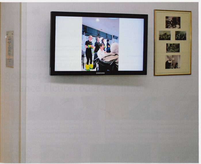
Bildschirm im Pflegeheim La Providence in Freiburg: Verbunden mit der Familie und mit der Welt.