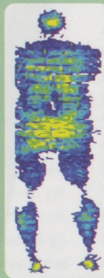
Druckmessung Trio-Cell Plus