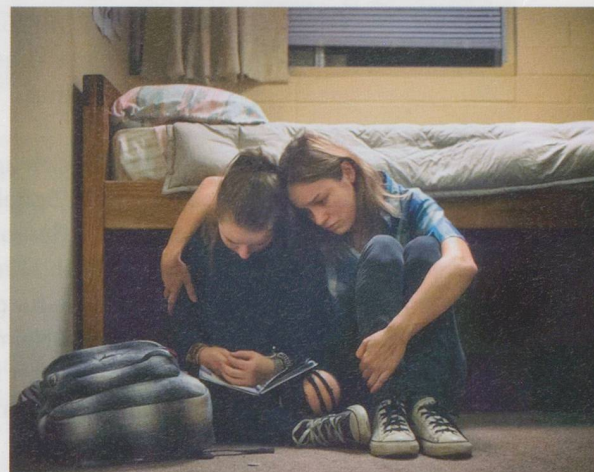
Szene aus «Short Term 12»: Bewegende Geschichte über sexuellen Missbrauch.

«Short Term 12», USA, Regie: Destin Daniel Cretton, 2013, 96 Minuten