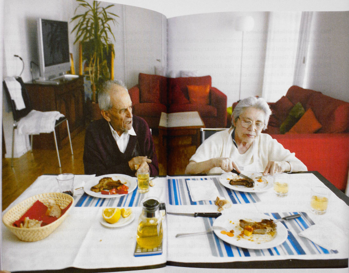
Mit der Demenz kommen die Fremdheitsgefühle: Der Vater des Fotografen wanderte von Sizilien nach Winterthur aus, wo er 33 Jahre lang

ihrerseits häufig emotional überfordert sind. So entstehen Missverständnisse auf beiden Seiten, die Qualität einer professionellen Übersetzung ist nicht gewährleistet.