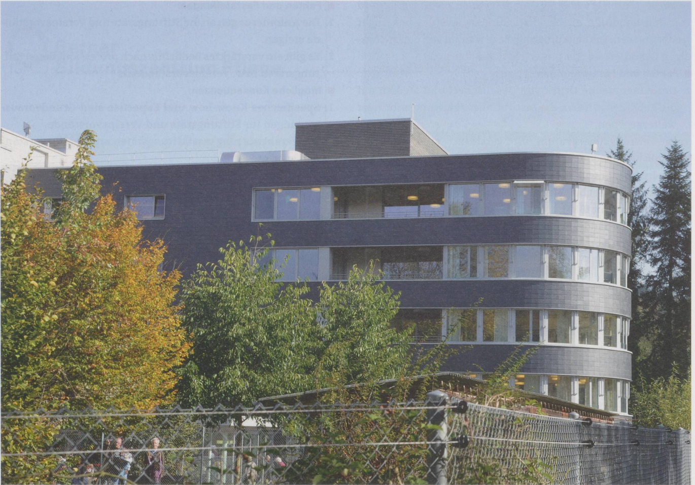
Pflegezentrum Reusspark Niederwil AG: Das Geschäftsmodell einer Institution ist nicht mehr in Stein gemeisselt. Was über Jahrzehnte erfolgreich angeboten wurde, wird morgen möglicherweise nicht mehr nachgefragt oder finanziert.