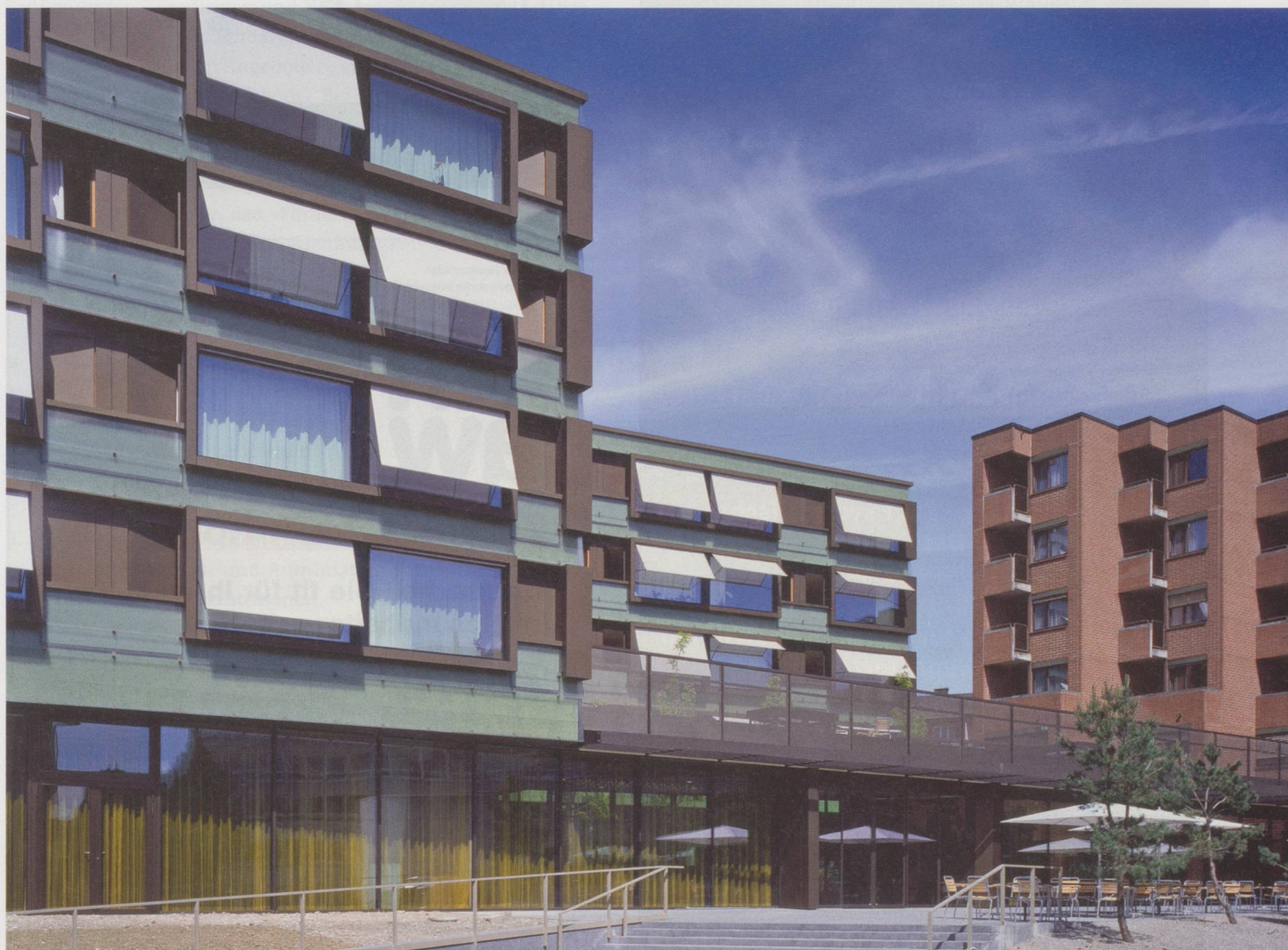
Alterszentrum Bruggwiesen, Illnau-Effretikon ZH: Wenn sich eine Institution für das Agieren entscheidet, ist es sinnvoll, den Handlungsspielraum in Bezug auf Strategie, Angebot, Finanzen, Führung, Personal, Hotellerie und Informatik zu analysieren.

Der Druck der Gesellschaft und der Medien auf die zuständigen Behörden (Finanzierer) nimmt ständig zu, insbesondere wenn >>