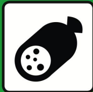
Charcuterie | Wurst- waren gekühlt