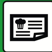
Papierwaren | Gebrauchsartikel

Über 100 Top Angebote warten auf Sie: www.pistor.ch/pistorprofit