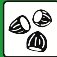
Nüsse | Trocken- früchte | Mehl