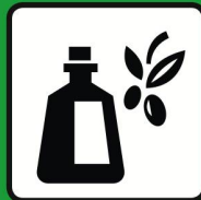
Öle | Pilze