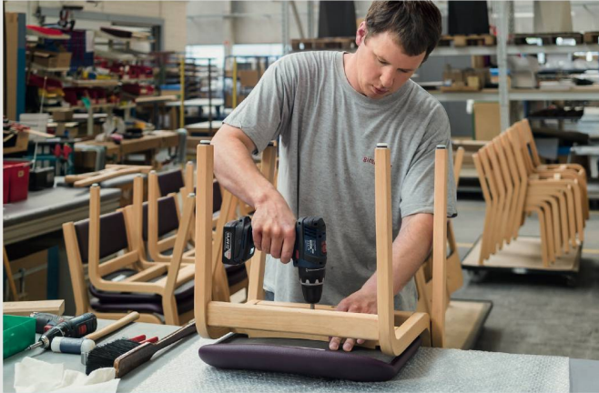
Ruferheim Nidau: Girsberger sandstrahlte, lackierte und polsterte 194 Holzstühle neu.