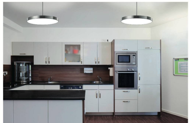
Sicherheit und Atmosphäre in der Küche mit der VIVAA LED Pendelleuchte