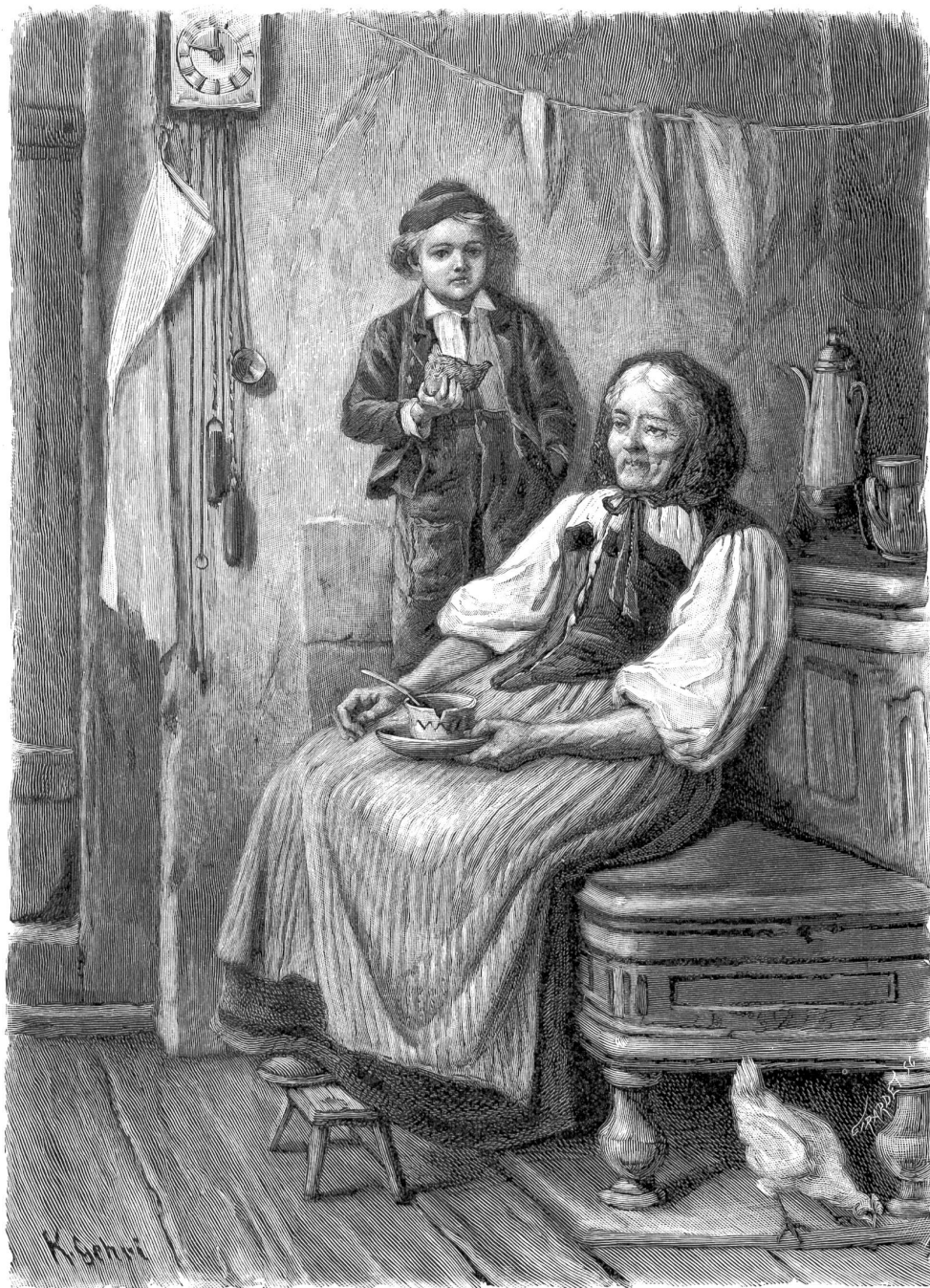
Käthi, die Großmutter: „E Gottlob, daß wir wieder daheim sind.“

Originalzeichnung von K. Gehri. Aus der illustrierten Gotthelf-Ausgabe, II. Teil. Verlag von F. Zahn, Chaux-de-Fonds.