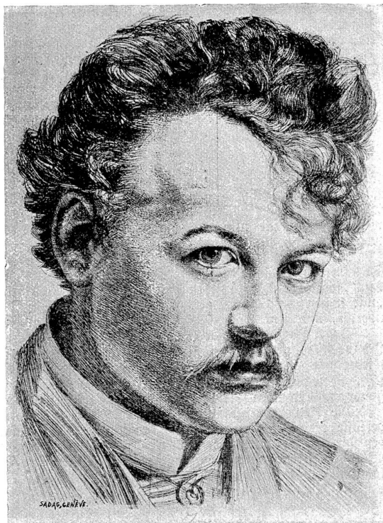
Selbstporträt Karl Staufers. Nach einer Radierung. Mit gütl. Erlaubnis der Kunsthandlung Amster & Rütardt abgedruckt.

Eine grüne Wiese. Und in der grünen, sonnenbeschienenen Wiese zwei große, farbige Flecken, ein roter und ein blauer. Die Flecken bewegen sich. Sie werfen blaue Schatten, die langgestreckt über die Wiese laufen. Jetzt nähern sie sich. Die zwei Flecken verwandeln sich in zwei kleine Kinder. Zwei winzige runde Geschöpfchen. Sie haben beide hellblondes Kraushaar und weit offene blaue Augen. Sie halten sich an den dicken Händchen und zotteln eifrig vorwärts. Aber die Sache ist nicht leicht. Bald liegt das eine, bald das andere auf der