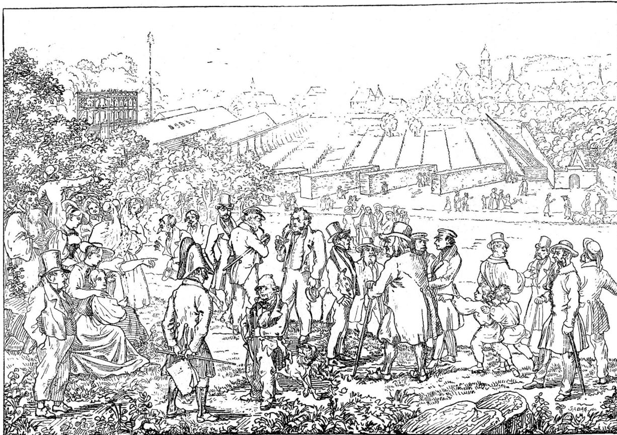
Eidgenössisches Freischießen in Solothurn (1840). Nach Distel.

Erde. Die runden nackten Beinchen zappeln über dem hohen Niedgras. Dann bleibt das zweite stehen, läßt das Mäulchen