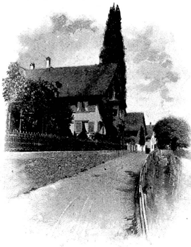
Wohnhaus C. F. Meyers in Kilchberg.