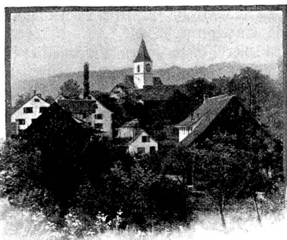
Kilchberg bei Zürich. Wohnort C. F. Meyers.

Am 28. November 1898, nachmittags 1 Uhr, ist Conrad Ferdinand Meyer an einem Herzschlag gestorben, und am 1. Dezember, vormittags 10 \frac{1}{2} Uhr, hat man den großen Dichter, den größten lebenden, den die Schweiz besaß, auf den stillen