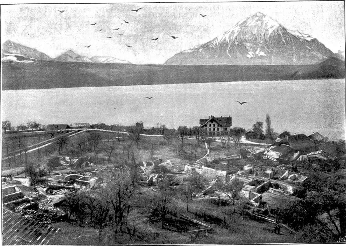
Brandunglück in Merligen.

Am 11. April, am Ostermontage wurde das hübsche Dörfchen Merligen am Thunersee, am Fuße des Beatenberges gelegen, ein Raub der Flammen. Das Feuer brach gegen 6 Uhr abends aus und wütete bis kurz vor Mitternacht. Im Verlaufe dieser wenigen Stunden brannten 41 Firste ab und