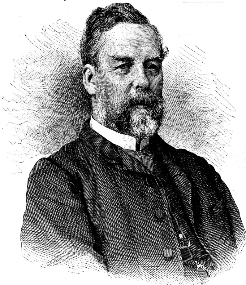
(Aus Schweiz. Porträtgalerie).

Milddthätige Gaben, auch wenn sie noch so bescheiden sind, werden herzlich verdankt und in diesen Blättern quittiert werden, und die Redaktion der „Schweiz“ bittet ihre Leser, ihr solche mit dem Vermerk „für die Verunglückten von Merligen“ zur Weiterbeförderung an das „Hilfskomite Merligen“ einzusenden.