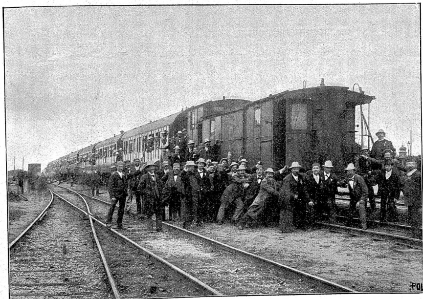
Sängerfahrt der Harmonie: Eisenbahnunfall auf Station Käferthal-Wolgelegen.

„Und blüht durch ferne Jahre dieses Bundes Segen, So dankt es mir durch Eure treue Gunst, Frohlockend singt auf Liedumprokzten Wegen: „Dies hat Musik gethan, die göttlich hohe Kunst.“ A. N.