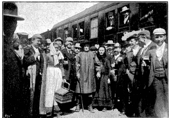
Sängereinfahrt der Harmonie: „Der erste Schwarzwälder in Sicht.“