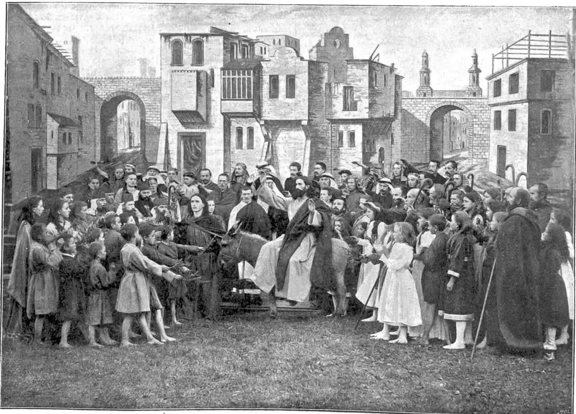
Einzug in Jerusalem.

Heimatsorte ein Gleiches zu versuchen, ward in dem rührigen Manne lebendig und ließ ihn nicht ruhen, wenn sich auch, und zwar bereits bei der ersten genaueren Prüfung, schon schier unüberwindliche Schwierigkeiten in den Weg stellten, deren vornehmlichste in dem Mangel der musikalischen Kräfte lag. Wie in so viel Fällen half der Zufall, der es notwendig erscheinen ließ, gegen Ende des Jahres 1890 einen neuen Lehrer für eine der Klassen an der Schule zu ernennen. Die Wahl fiel glücklicherweise auf einen Mann von mehr als gewöhnlicher musika-