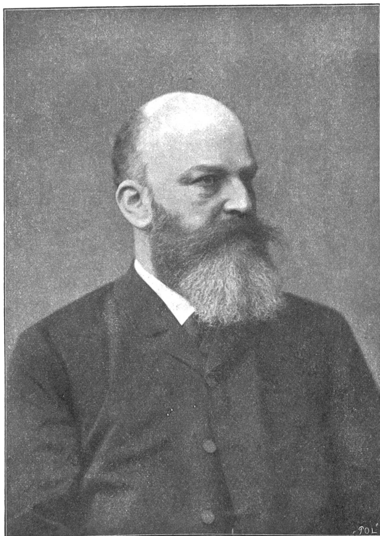
Georg Ebers, † 7. Aug. 1898.

Der am 7. August auf seiner Besitzung in Tusing am Starnbergersee verstorbene Georg Moritz Ebers wurde am 1. März 1837 in Berlin geboren, wandte sich vorerst dem Studium der Rechte zu (1856) und erst nachher, vornehmlich durch Lepsius' Einfluß, der ägyptischen Altertumskunde. Im Jahre 1865 ließ er sich in Jena als Professor für diese nieder. Seine bedeutende Kenntnis der altägyptischen Geschichte hat er auf zwei ausgedehnten Reisen in Ägypten und Nubien aufs gründlichste vertieft. Zu den wissenschaftlich bedeutendsten Funden muß derjenige des nach ihm benannten, jetzt in der Universitätsbibliothek in Leipzig aufbewahrten Papyrus Ebers' gezählt werden, der über die Arzneimittel der alten Ägypter hervorragende Aufschlüsse gab.