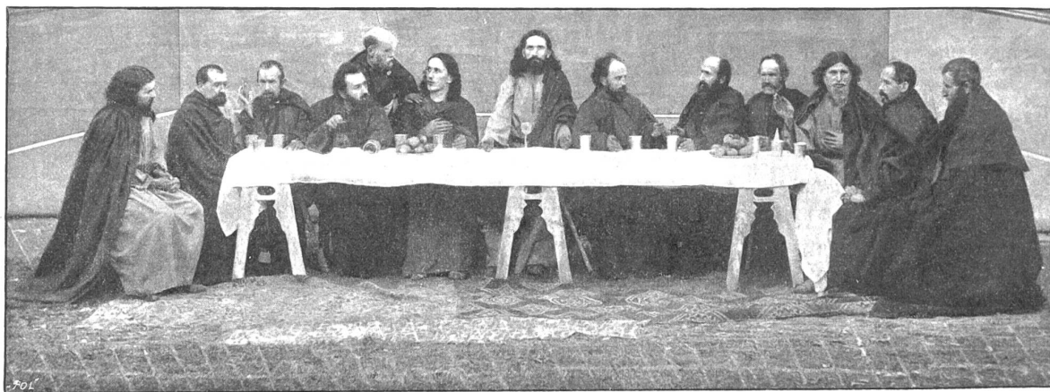
Passionsspiele in Selzach: Das h. Abendmahl.

licher Begabung, und seinen Anstrengungen in dieser Richtung ist es zu verdanken, daß nach einem Jahre bereits an die Aufführung der Jubiläums-Messe von Witt Op. 12 gedacht werden konnte. In raschen Schritten gieng es vorwärts, so zwar, daß nach Verlauf eines weiteren Jahres das Passions-Oratorium von Rev. S. J. Müller, mit besonderem Arrangement, Einlagen von Prologen und deklamatorischem Text aufgeführt wurde. Der Winter 1892 sah das Weihnachts-Oratorium von Hering, das einen gewaltigen Erfolg hatte, und das darauffolgende Jahr gelangte das Passionspiel zum ersten Male zur Aufführung.