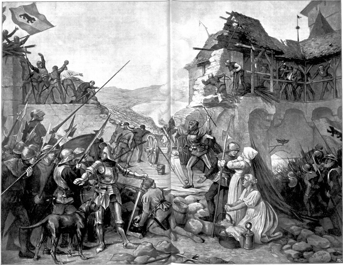
— In Maren. 22. Juni 1276. — Gemälde von 1858. Töpfer, München.