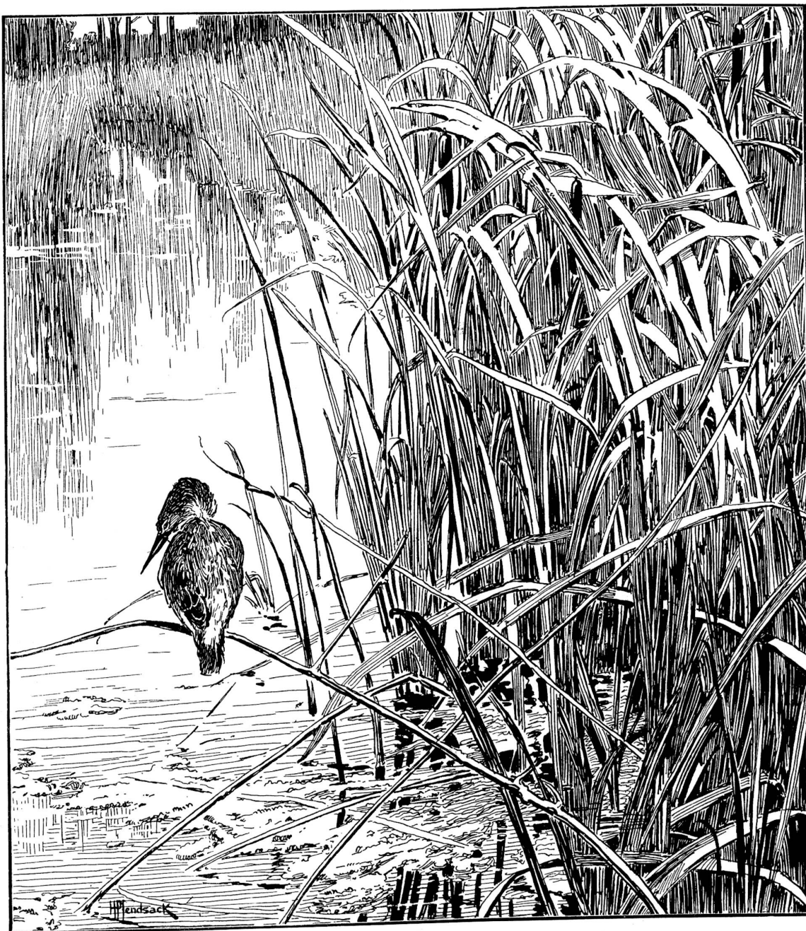
Eisvogel. Originalzeichnung von G. Pfendtsack (Bruntrut), Paris.

weicht oder wenn am Abend, da das letzte Rot am Himmelsjaum verglimmt und die andern Vögel alle schweigen, sie damit den zur Küste gegangenen Tag in Schlummer singt. Die „Diva“ ist sie unter unserem Waldgefieder!