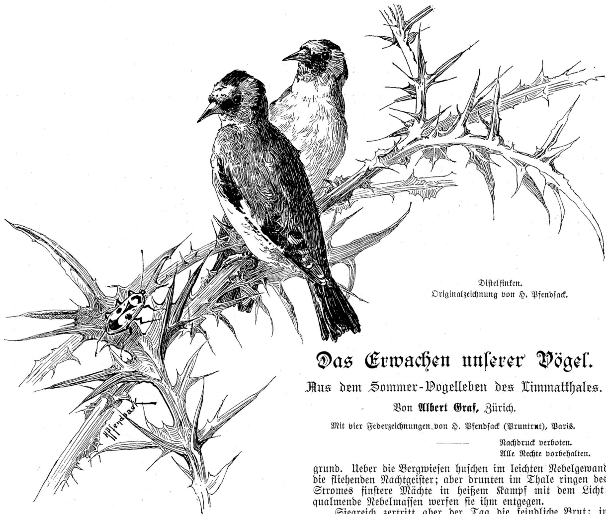
Distelfinken. Originalzeichnung von S. Pfensack.