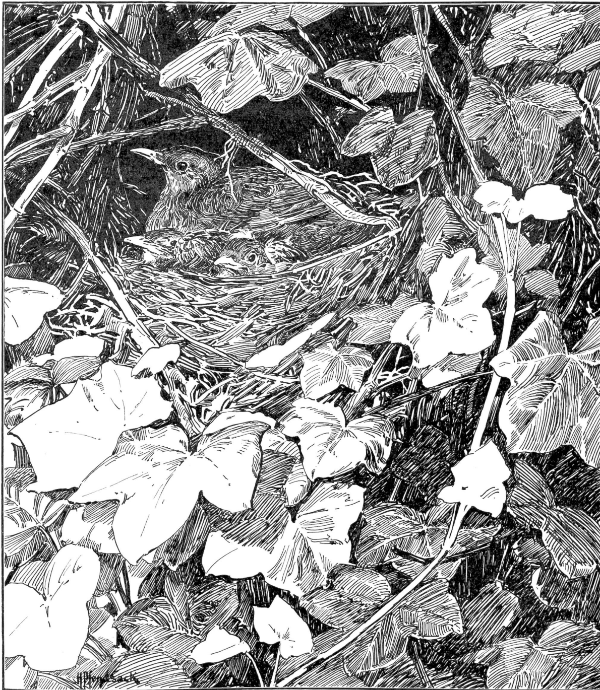
Amfelnest. Originalzeichnung von S. Pfensack (Bruntrut), Paris.

Morgengrauen das vielgeschäftige Volk der Nacht. Unter Moos und Steinen, an Quell' und Bächen treibt es sein geheimnisvolles Wesen, bis der erste Sonnenfunken durchs Gezweige bricht und es in seine unterirdische Behausung schreckt. Lange wird es nicht mehr dauern; denn vom Thale steigt der junge Tag zu Berg und erobert sich im Sturm den Waldsaum