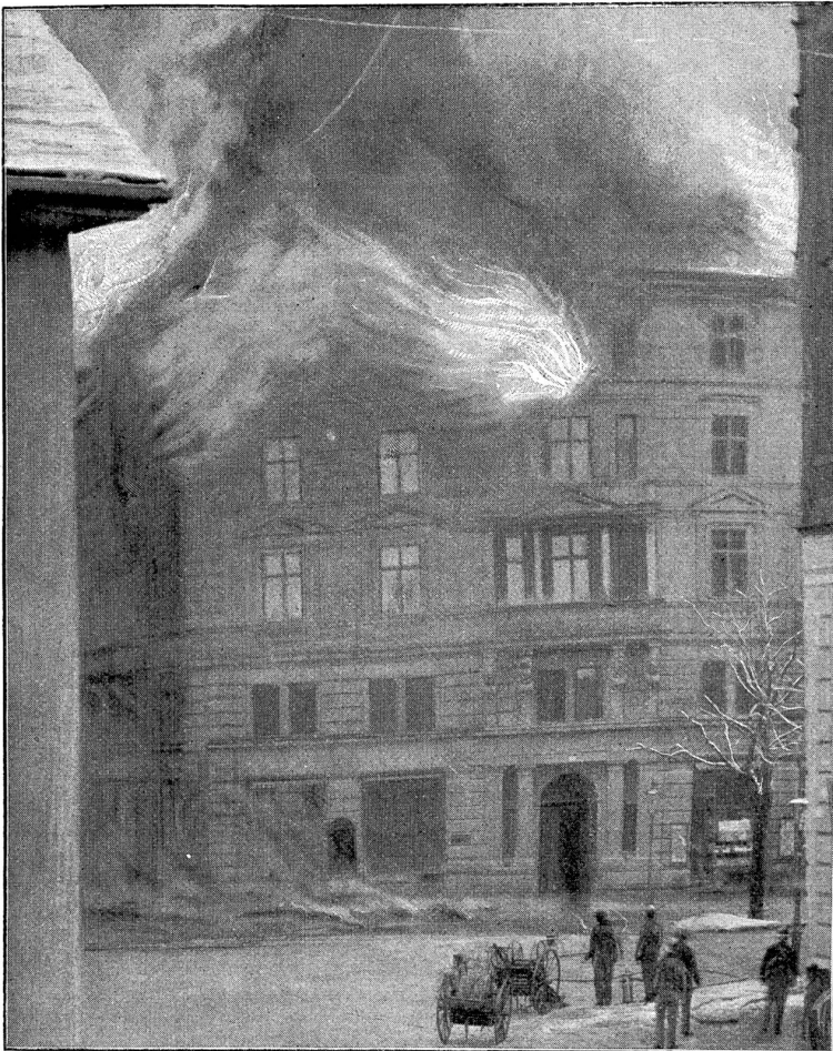
Die brennende Zentrale.

seits erforderte die in raschem Wachstum begriffene Zunahme der Telephon-Abonnenten ein fortwährendes Nachziehen von Drähten, die häufig in Bündeln von vielen Hunderten die Straßen überqueren. — Wenn auch, der Vorschrift entsprechend, an vielen Stellen, an denen die Telephondrähte hoch in der Luft das Tramkabel kreuzen, Sicherheitsnetze angebracht waren, um im Falle des Reißens eines Telephondrahtes dessen Anschluß an die Starkstromleitung zu verhindern, so war die Durchführung dieser nützlichen Maßregel doch nicht überall möglich. Das Unglück wollte es nun, daß infolge Überbelastung durch Schnee einer — oder