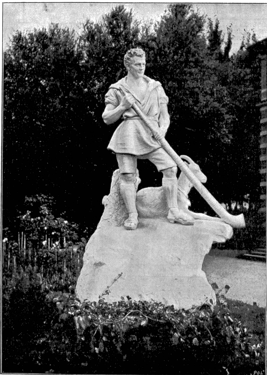
Der Alphornbläser. Marmorstatue von Herß, Zürich.

„Füch'slein, Füch'slein,“ raunte er ihm ins Ohr, „laß die Ungebuld, das war heut' unsre letzte Fahrt zusammen!“