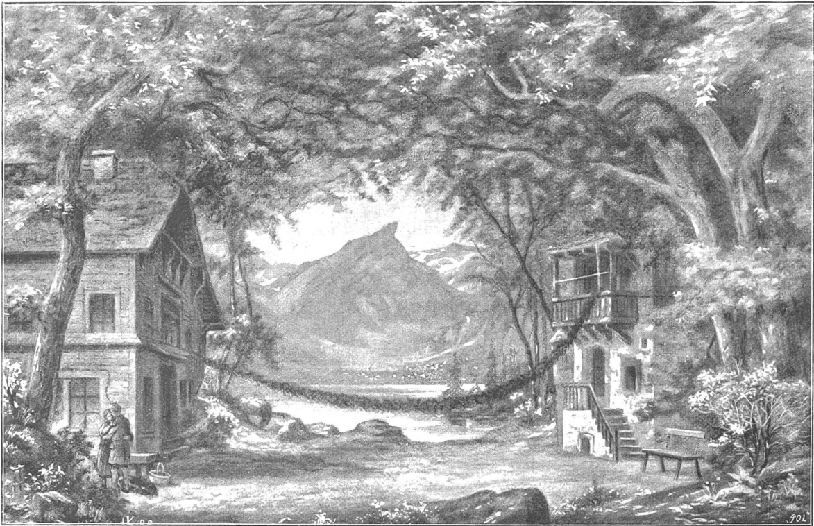
Das Nöski vom Säntis. Dekoration des I. Actes: Am Seealpfec. Nach der ersten Aufführung am Stadttheater in Zürich gezeichnet von Herrn. Kullert, Zürich.