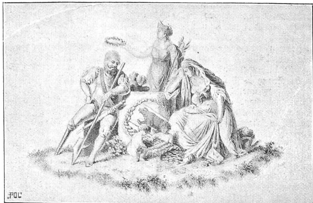
Titelvignette zu den Pensionsbreveis für Hinterlassene.