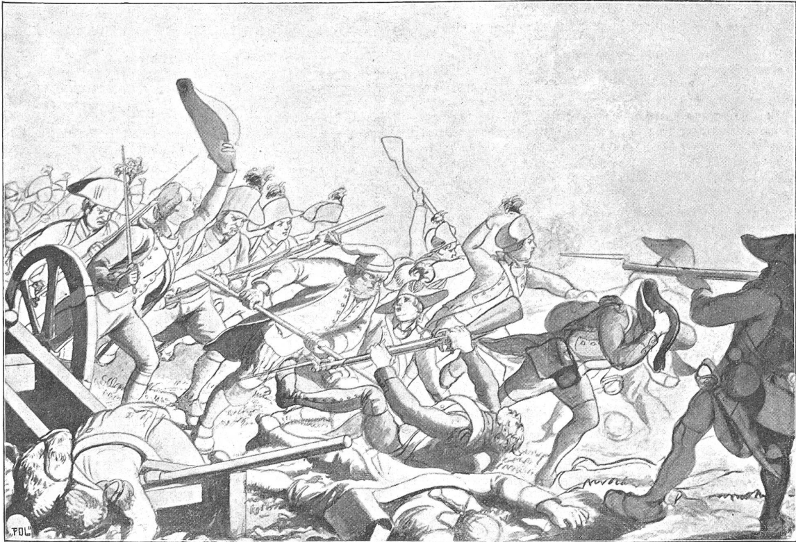
Handzeichnung von Maler F. Walthard: Gefecht bei Neuenegg. Im Besitz von Major G. v. Erlach.

ist reich an interessanten Figuren. An Popularität kommt aber niemand der ehrwürdigen Person des greisen Schultheißen nahe, welcher die Winternacht am Wachfeuer zubringt und im letzten Freiheitskampfe umsonst die erlösende Kugel ersehnt; als ein Geächteter muß er fliehen und ein Jahr lang das harte Brot