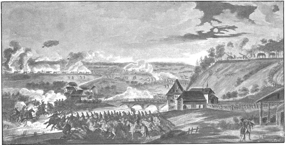
Das Nachtgefecht von Neuenegg (4. auf 5. März 1798).

Nach einer dem General Brune gewidmeten kolorierten Radierung von Citoyen François Müller de Fribourg.