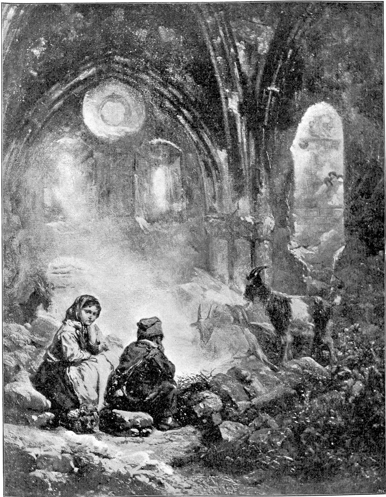
In der Kapelle von Tourbillon (Sitten, Wallis). Gemälde von J. Nig, Sitten.