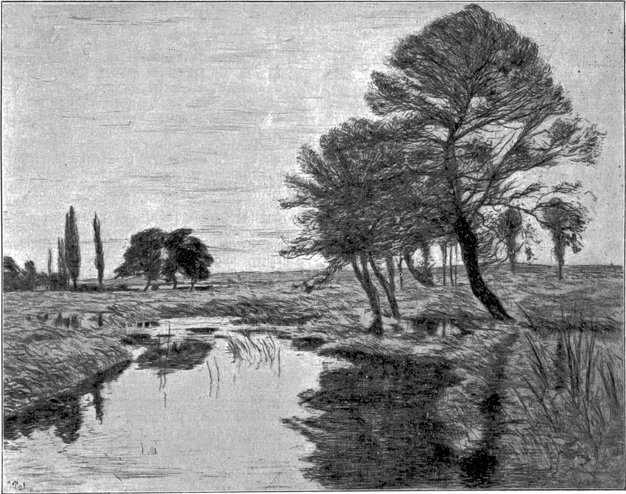
Nach einer Radierung von Karl Th. Meyer, Basel (in München).

Sie gingen also weiter, gelangten zum „Rößli.“ Dieses Wappentier gefiel unserm Bauernsohn schon besser, das Roß heimelte ihn ordentlich an, gemahnte ihn an seinen „Schimmel“ zu Hause. „Hier gehen wir hinein!“ sprach er rasch entschlossen. Sie stiegen die teppichbelegte Haustreppe langsam hinan, gelangten an eine Glashüre, pochten behutsam an. Die Thüre