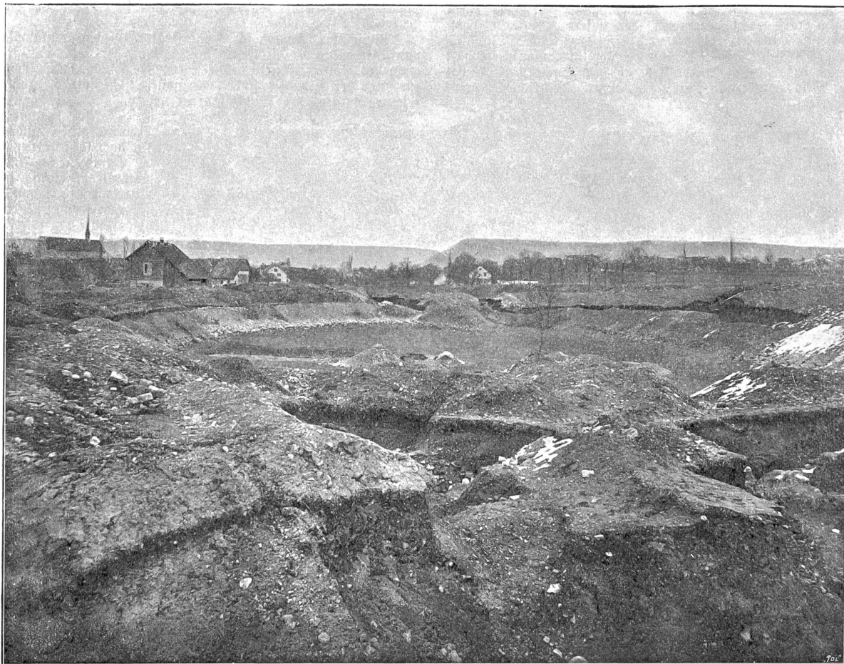
Das römische Amphitheater in Windisch: Gesamtansicht vom Südwesteingang aus.