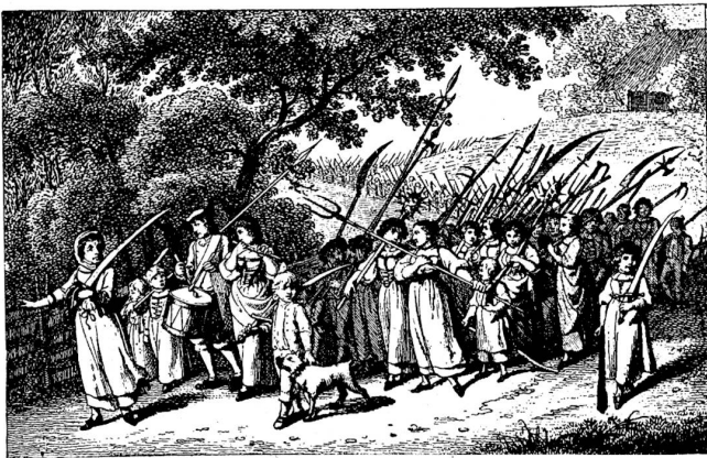
Der Landsturm. F. W. König del., K. Lips, sculp.

So sonderbar auch diese Formel lautete, so muß man sich doch darüber wundern, daß sich nun die Nidwaldner, von einigen Geistlichen geleitet, so sehr daran stießen und befürchteten, daß ihre angestammte Freiheit und die Religion dadurch gefährdet werden. Sie hatten dazu allerdings einige Veranlassung in dem Auftreten der französischen Revolutionsregierung, deren Geist in einem gewissen Maße auch bei den helvetischen Behörden sich geltend machte. Es fanden nun mehrfache Verhandlungen statt über gewisse Garantien, welche den Nidwaldnern bei Leistung des Eides in dieser Beziehung gegeben werden sollten, doch führten dieselben zu keinem Ziel, ja das Direktorium verhielt sich den Abgesandten aus Unterwalden gegenüber stets schroff und ablehnend. Auch auf Seite der Nidwaldner wurde die Erbitterung und die Abneigung, den Eid zu leisten, immer größer