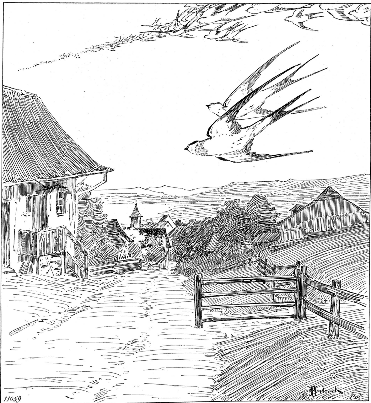
Schwalbenflug. Originalzeichnung von Hugo Pfenbsack.

arten sind dort mehr zu Hause, als im Wauwylermoos, dort hält sich auch etwa einmal im Winter ein Steißfuß ( Podiceps cristatus ) oder ein Nordseetaucher ( Colymbus septentrionalis ) auf, und dort sind schon mehrmals Kormorane erlegt worden ( Carbo cormoranus ). Mehr aber als am Mauensee kommen diese Verhältnisse am Sempachersee zur Geltung. Da ist im Winter erst das echte Wasserleben der Wintergäste zu beobachten. Da tummeln sich auf der Wasserfläche alle genannten Entenarten, zu einem großen Schwarm von oft mehreren hundert vereint, wobei sich noch neue Arten einfinden. Da sieht man die Schellente ( Clangula glaucion ) in kleinen Truppen, da ist schon die Brandente ( Tadorna cornuta ) erlegt worden, und da wurde auch im Januar 1880 eine Eisente ( Harelda glacialis ) erbeutet. Alle diese Enten haben von den Seejägern den Sammelnamen „Zugenten“ erhalten. Der Sempachersee bietet im Winter diesem großen „Zugentenschwarm“ einen verhältnismäßig sichern Aufenthaltort. „Verhältnismäßig“ deswegen, weil sie von den