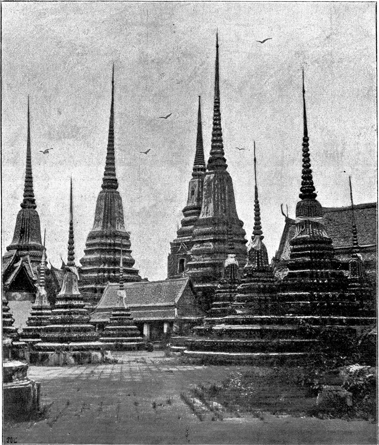
Im Tempelhofe von Bra Rao. (Die spizen Türmchen sind die im Artikel vielfach erwähnten Praschedis).

Zum Schutze gegen diese Krankheit stecken die Siamesen hohe Bambusstäbe, mit Lappen zc. behangen, vor dem Hause auf und erblicken darin ein wirkungsvolles Zaubermittel.