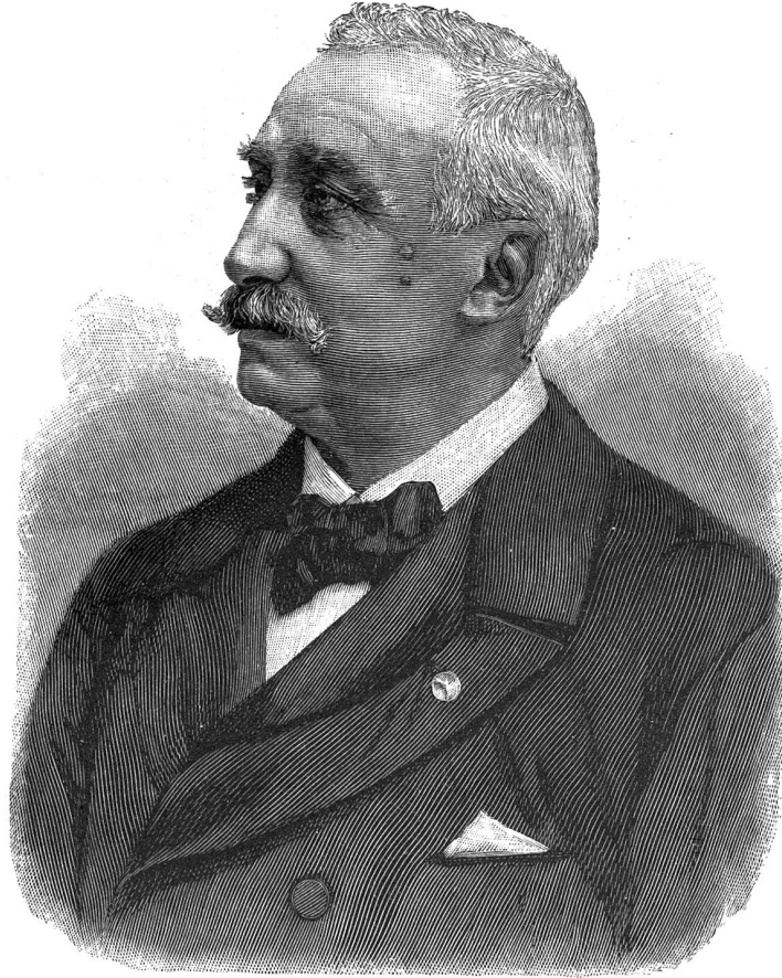
Felix Faure, † 16. Februar,

Heute ist diese reizende Tracht längst verschwunden und das Schweizerische Landesmuseum darf sich dazu beglückwünschen, daß seine Trachtenammlung wenigstens ein vollständiges Kinderkleidchen birgt, das wir zum Vergleiche mit dem Trachtenbilde Ludwig Vogels unserem Texte einreihen. In den schönen Thälern der Neuf, Bünz und kleinen Emme aber suchen wir vergebens nach Erscheinungen, wie sie uns der Künstler so reizend vor die Augen führt; dafür aber pufst überall das Dampfroß, dessen niedlicherer Einfluß selbst nicht ohne Wirkung auf diese im allgemeinen noch sehr an ihren alten Sitten und Gebräuchen hängende Landbevölkerung blieb.