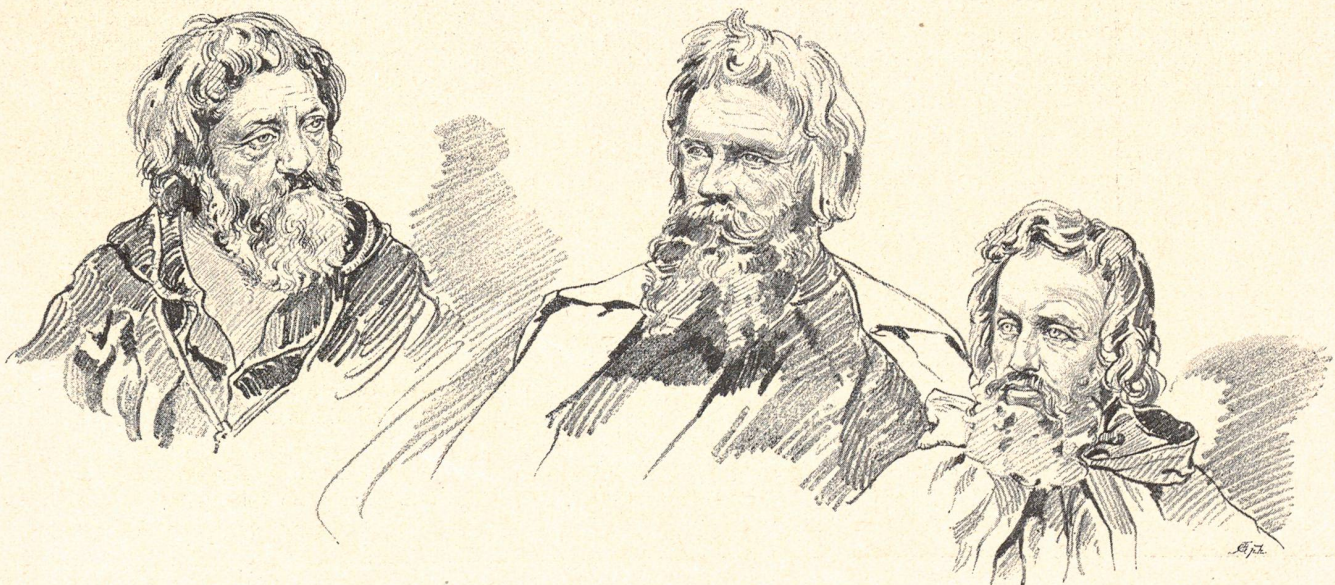
5. Knubi, der Fischer.

Das Schauspielhaus in Hochdorf wurde massiv aus Stein erbaut, selbst die Treppen im Theater sind aus Stein ausgeführt und das Ganze macht den wohlthuenden Eindruck der