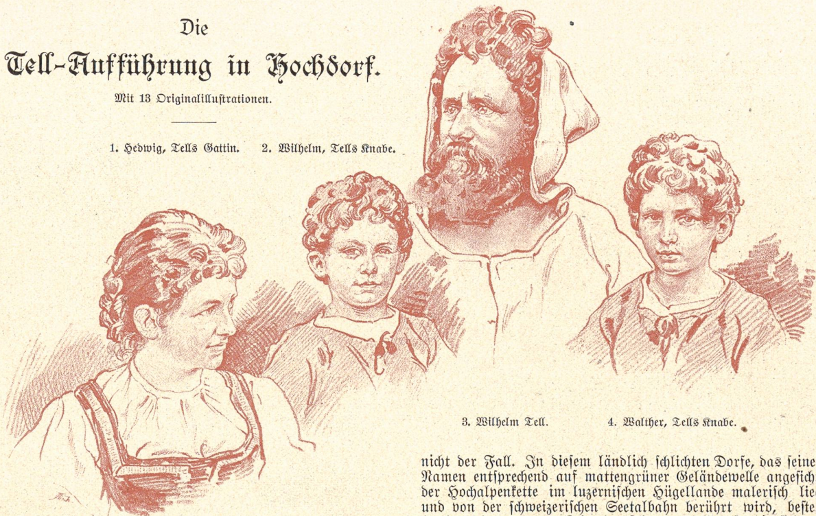
3. Wilhelm Tell.