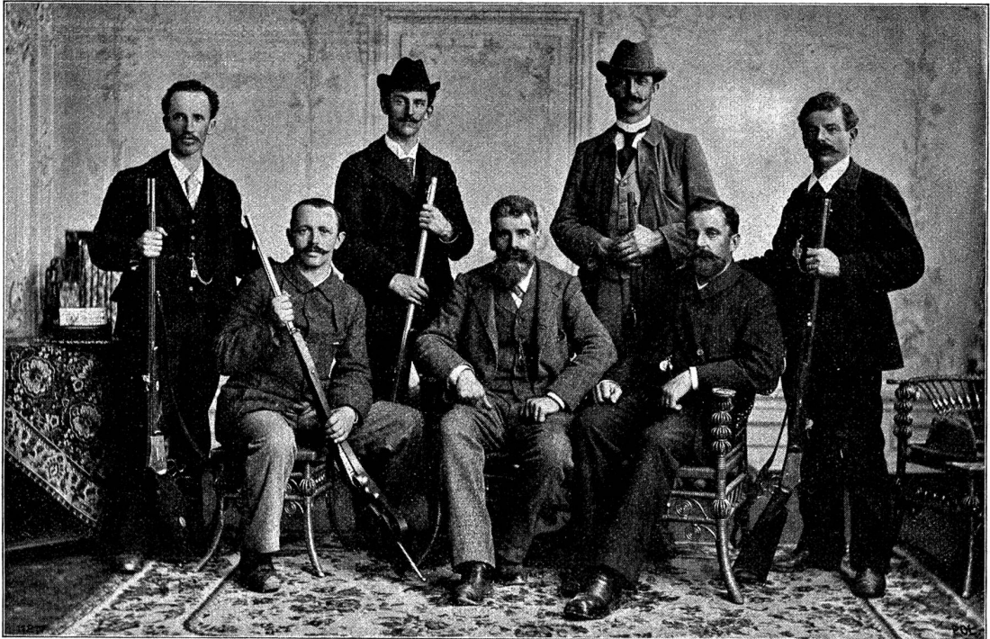
Beste Knieendenschüsse aller Länder. Die schweizerischen Champions des internationalen Wettbewerbes in Loosduinen, Holland. Beste Stehendschüsse aller Länder.