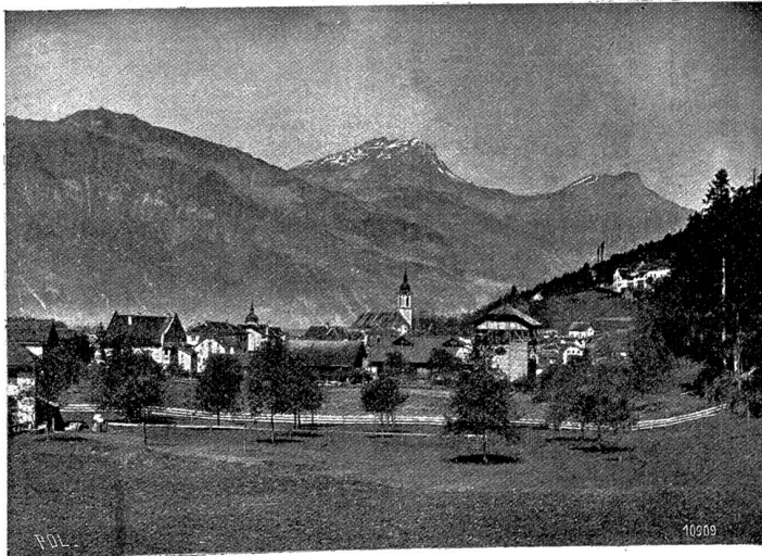
Altdorf mit Schauspielhaus im Vordergrund. Im Hintergrund Ober- und Niederbauen (Seeltsbergerkulm)

trat mit und neben dem genannten Vereine der „Männerchor Altdorf“ (40 Aktivmitglieder, gegründet 1850) führend hervor. Blindefnde Silberpokale im Vereinslokal z. „Löwen“, Preise mühevollen Ringens von Säng'ern, sprechen für die Thaten der Väter, Diplome, Photographien zc., für das erfolgreiche Wirken und Schaffen der Söhne. In neuerer Zeit gesellte sich dem „Männerchor“ die „Harmonie“ Männergesangverein von 20 Mitgliedern) würdig an die Seite, und eine Feldmusikgesellschaft (25 Mann) sorgt für die nötige Abwechslung. Von