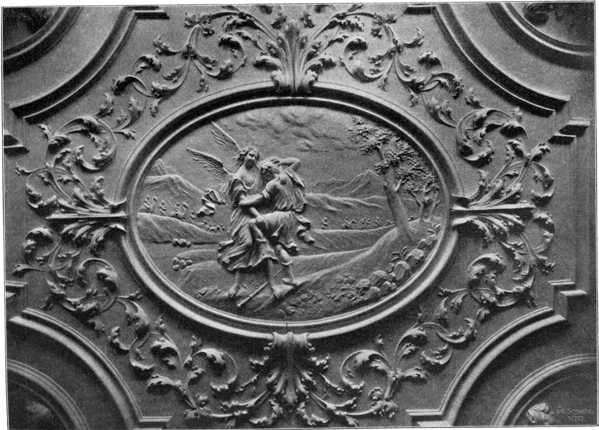
Der untere grosse Saal und Detailansicht der Decke (1721) im „Grossen Haus“ in Schaffhausen.